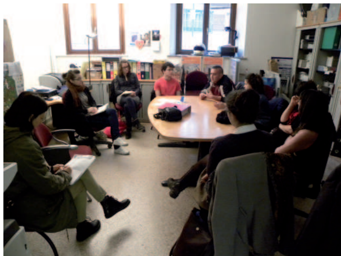
22 gennaio Incontro presso il nostro ufficio

Il 16 di dicembre si è tenuto un incontro informativo presso il nostro ufficio, mentre a gennaio due sono state le tappe del Tour: il 22 un incontro informativo presso il nostro ufficio e il 23 un incontro in occasione della giornata "Youth Adrinet Opportunity Day" organizzata dal Comune di Gorizia.