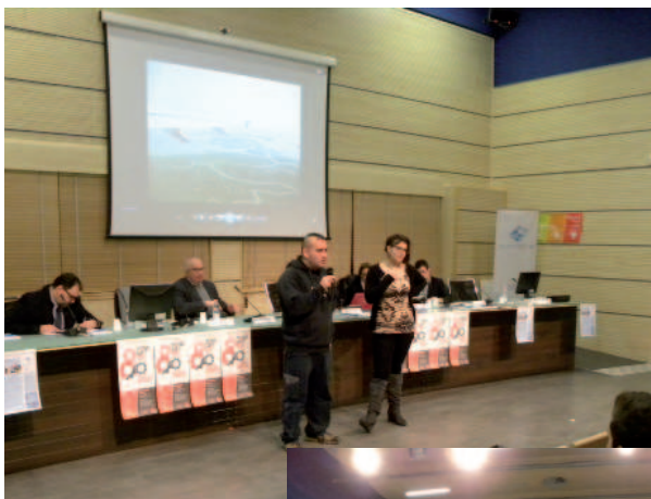
23 gennaio Incontro a Gorizia