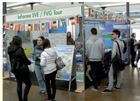
Stand durante la Fiera Young di Udine (12-15 marzo)

mercoledì 16 aprile - Tappa presso il Comune di Monfalcone