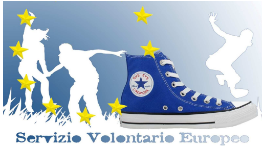
Servizio Volontario Europeo